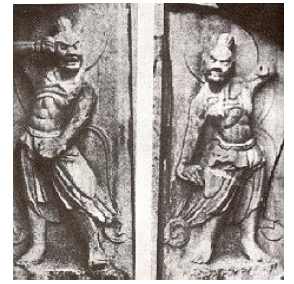
Le Roi Deva – Emblème JJK

Pour preuve, dans les années 1950, près de la frontière nord-coréenne, des peintures de techniques martiales ont été retrouvées dans une grotte protégée : le Roi Deva protégeant le Bouddha.